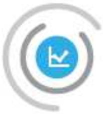
Schéma Régional de Développement Economique, d'Innovation et d'Internationalisation (SRDEII)