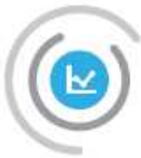
Schéma Régional de Développement Economique, d'Innovation et d'Internationalisation (SRDEII)