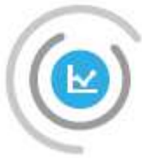
Schéma Régional de Développement Economique, d'Innovation et d'Internationalisation (SRDEII)